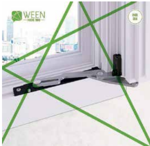
MASTER - Ween Hide