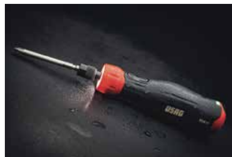
USAG - Giravite elettrico 324 XP