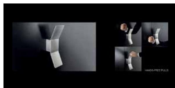
PBA - Hands Free