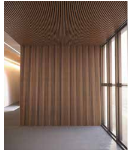
DFV - Skin