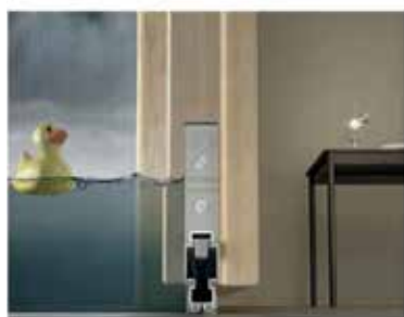
CCE - Idromini Wood