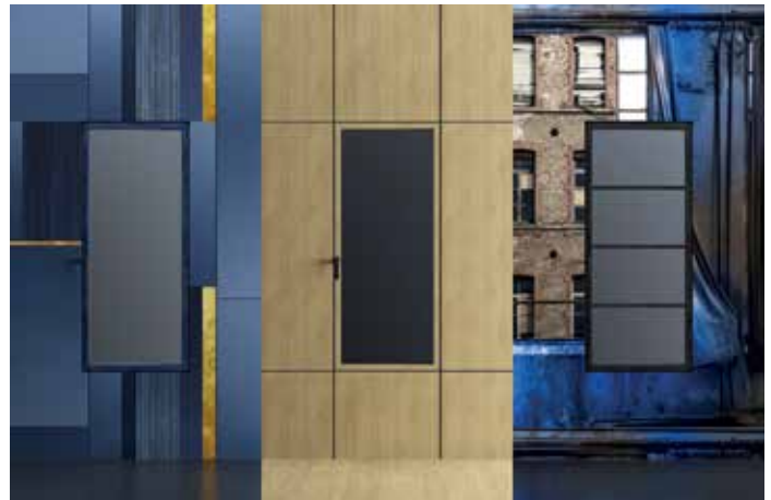
UNIFORM - magis40