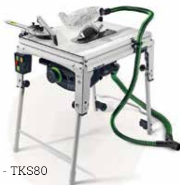
FESTOOL - TKS80