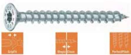
HECO - TOPIX - plus