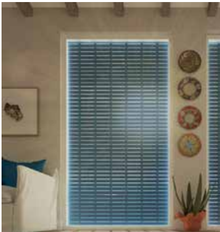
PINTO - AriaLuce